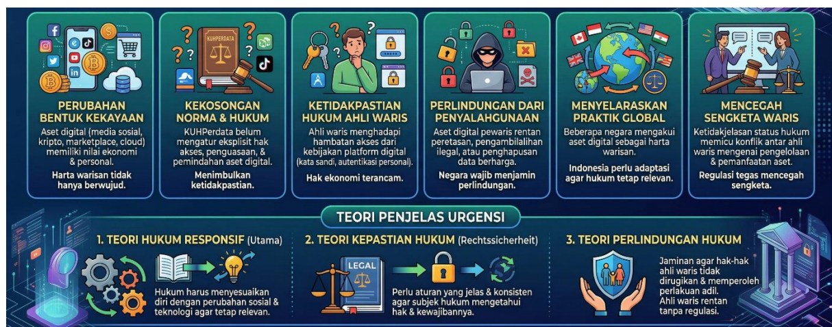
Gambar 2. Urgensi Pengaturan Pewarisan Digital di Indonesia

Menurut pendapat penulis, urgensi pengaturan pewarisan digital dalam memberikan perlindungan hukum bagi ahli waris di Indonesia merupakan konsekuensi logis dari perubahan bentuk kekayaan di era digital. Teori hukum responsif menjadi landasan utama yang menegaskan bahwa hukum waris harus dikembangkan agar mampu menjawab kebutuhan masyarakat modern. Tanpa adanya pengaturan khusus, prinsip kepastian hukum dan perlindungan hukum bagi ahli waris sulit diwujudkan secara nyata.