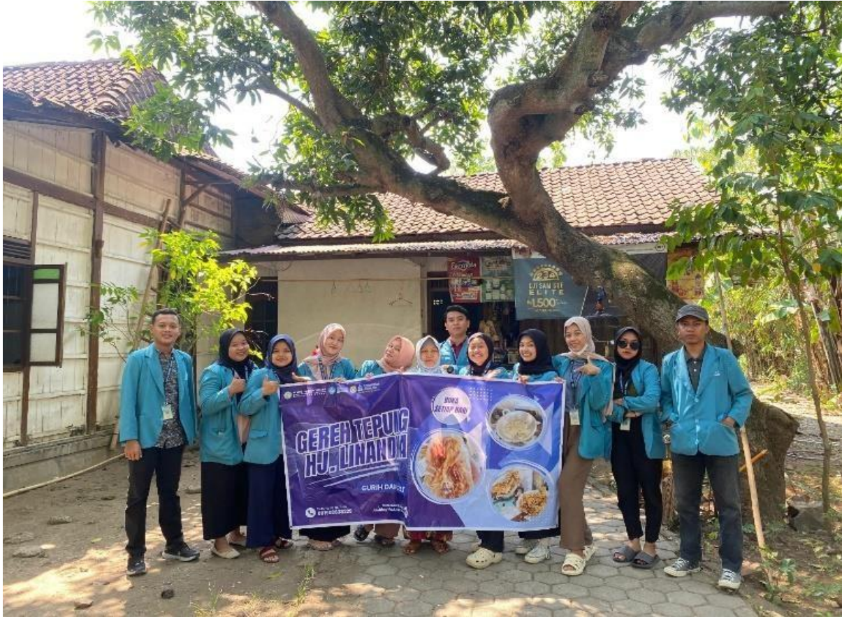
Gambar 2. Kegiatan UMKM

Intervensi ini merupakan contoh nyata dari upaya menjembatani "kesenjangan digital" (digital divide) yang sering kali menghambat pertumbuhan UMKM di daerah pedesaan. Studi Ardiansyah menunjukkan bahwa digitalisasi adalah katalisator penting untuk inovasi dan daya saing UMKM, yang memungkinkan peningkatan efisiensi operasional dan perluasan akses pasar secara signifikan. Namun, banyak UMKM, terutama di luar pusat perkotaan, menghadapi berbagai kendala seperti keterbatasan sumber daya, infrastruktur digital yang tidak merata, dan rendahnya literasi digital [9]. Peran mahasiswa KKN dalam konteks ini menjadi sangat strategis. Mereka tidak hanya bertindak sebagai agen transfer pengetahuan, sebuah peran yang ditekankan oleh penelitian sebagai faktor kunci dalam meningkatkan kesiapan digital UMKM, tetapi juga sebagai eksekutor langsung [10].