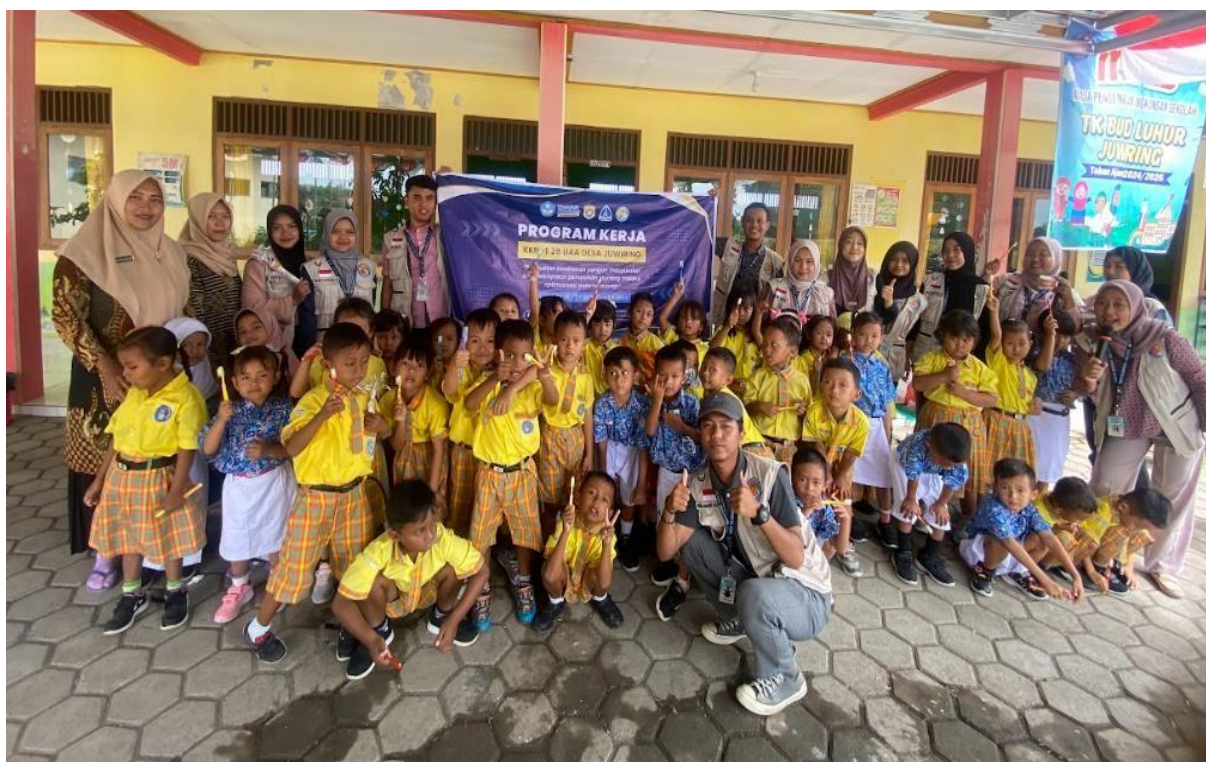
Gambar 1. Sosialisasi PHBS

Intervensi kesehatan yang dilakukan oleh mahasiswa KKN-T di Desa Juwiring selaras dengan strategi penanganan stunting berbasis komunitas yang direkomendasikan secara luas. Literatur menyoroti bahwa intervensi gizi yang efektif harus bersifat terintegrasi, menggabungkan intervensi spesifik (seperti suplementasi dan edukasi gizi) dan sensitif (seperti peningkatan sanitasi dan ekonomi keluarga). Program penyuluhan dan workshop yang dilaksanakan merupakan bentuk intervensi gizi spesifik yang berfokus pada perubahan pengetahuan, sikap, dan praktik ibu, yang merupakan kunci utama dalam pencegahan stunting . Keterlibatan mahasiswa sebagai fasilitator dan pendamping sejalan dengan model intervensi yang memberdayakan kader kesehatan dan komunitas lokal. Demikian pula, program edukasi PHBS pada anak usia dini mengadopsi pendekatan pedagogis yang terbukti efektif. Studi Utami menunjukkan bahwa pembelajaran tentang gizi dan kesehatan pada anak-anak prasekolah paling berhasil ketika menggunakan metode eksperiensial, berbasis sensorik, dan menonjolkan peran model ( role modeling ) [6]. Mahasiswa, dalam hal ini, tidak hanya menyampaikan informasi, tetapi juga bertindak sebagai teladan dan memfasilitasi praktik langsung, seperti sikat gigi bersama, yang dapat menanamkan kebiasaan sehat sejak dini [7].