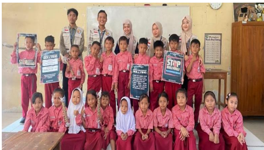
Gambar 3. Sosialisasi Anti Bullying

Intervensi di sektor pendidikan menyorot dua aspek: penguatan karakter sosial-emosional dan dukungan akademik. Program penguatan karakter diwujudkan melalui "Sosialisasi Anti-Bullying" yang ditujukan bagi siswa kelas 2 dan 4 di SDN 1 Juwiring. Menggunakan metode interaktif seperti diskusi, permainan peran, dan pemutaran video, mahasiswa memberikan edukasi mengenai berbagai bentuk perundungan ( bullying ), dampaknya, dan cara-cara pencegahannya. Sementara itu, untuk dukungan akademik, diselenggarakan program Bimbingan Belajar ( Bimbel ) secara rutin dua kali seminggu di tiga lokasi berbeda di Desa Juwiring. Program ini memberikan pendampingan kepada siswa sekolah dasar dalam mengerjakan tugas dan memahami materi pelajaran yang dianggap sulit. Kedua program ini dilaporkan mendapat sambutan yang sangat antusias dari para siswa dan pihak sekolah, dengan adanya peningkatan kesadaran mengenai isu perundungan dan minat belajar yang lebih tinggi di kalangan peserta Bimbel .