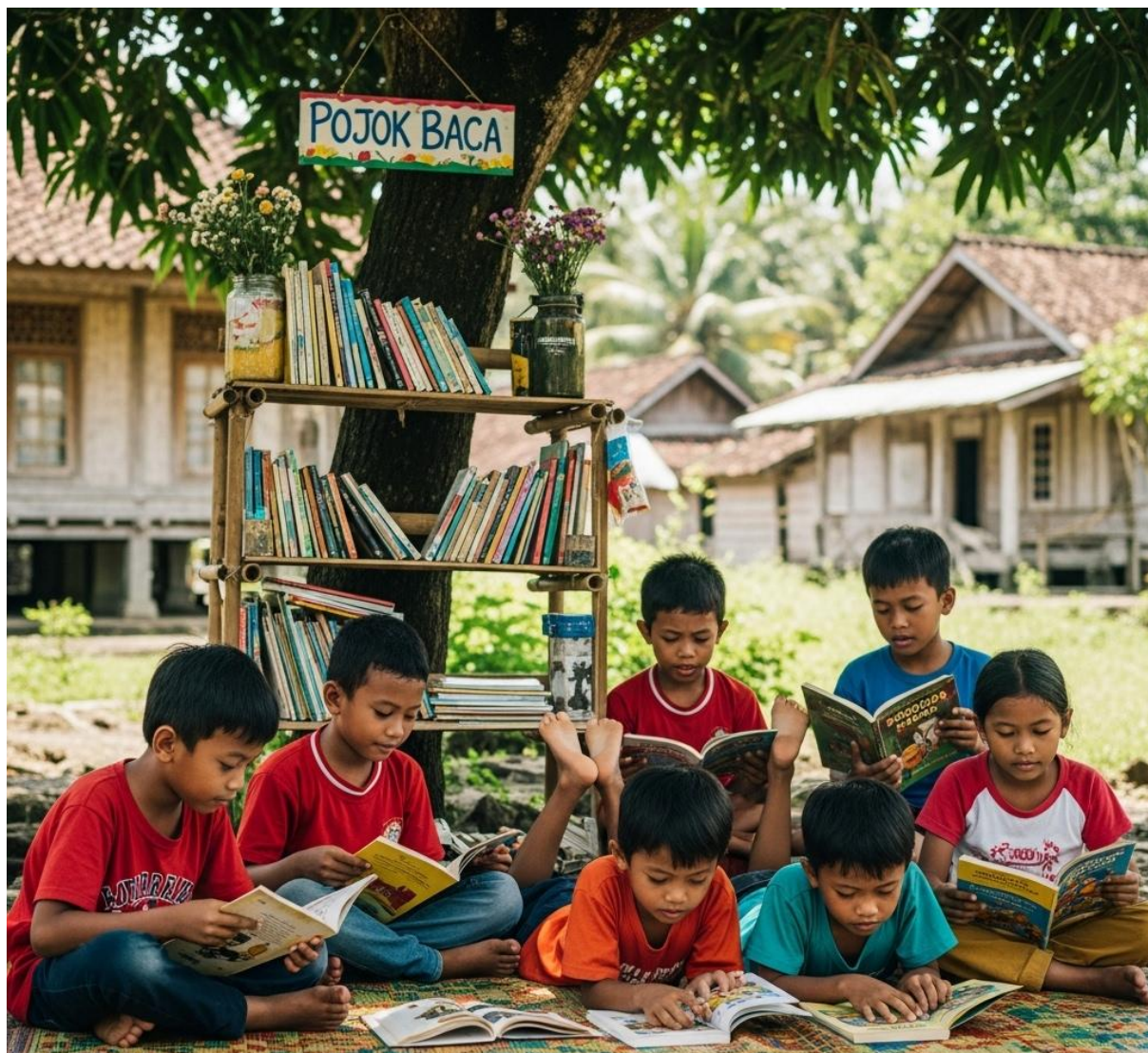
Gambar 1. Pojok Baca