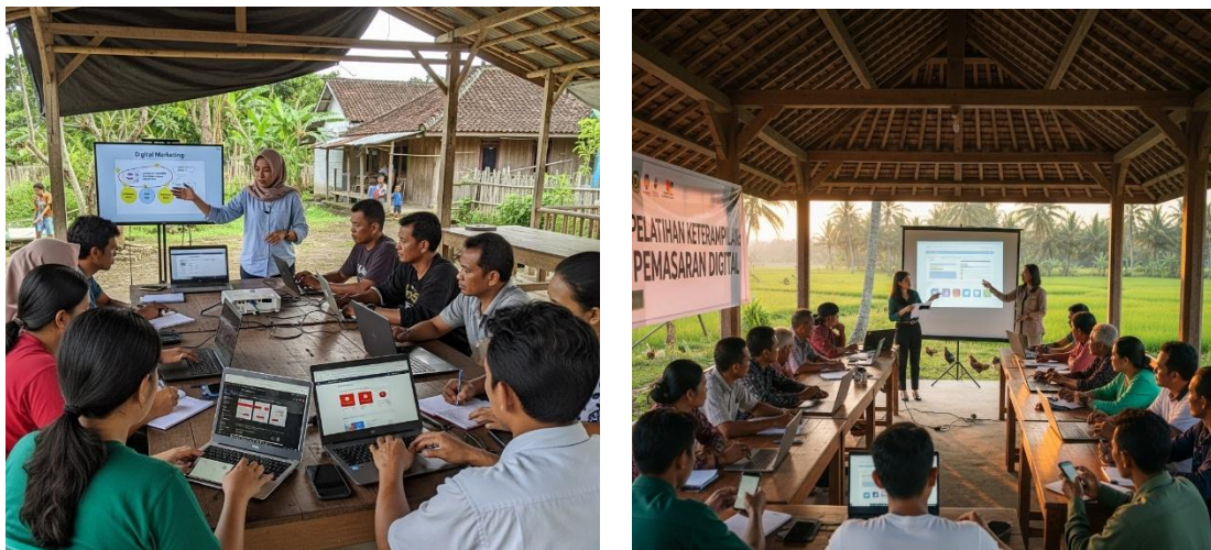
Gambar 3. Pelatihan Keterampilan Terapan: Pemasaran Digital

pasar tradisional. Inisiatif ini selaras dengan studi Taptajani dkk yang menegaskan peran literasi digital sebagai instrumen strategis untuk mendorong pembangunan ekonomi yang inklusif dan berkelanjutan di wilayah pedesaan [6].